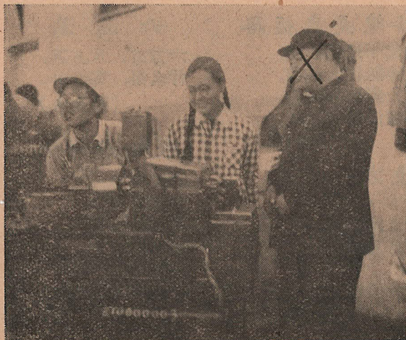
經常高院院長關心同學勤工儉學活動，下車間了解同學生產和思想收穫。

旱的時候，天上忽然翻起烏雲，接着下起大雨，機60.4和60.3班卅多人，馬上趁着這個好機會，搶種了七分多地的蕃茄，現在這塊地上的蕃茄苗長得特別好。眼看著親手栽種的菜漸漸長大了，大家就更愉快，干劲也更大。最近冶金系很多班分配到的任務已超額完成。