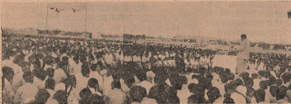
爭取五年內成為紅旗學院的戰鬥開始了！

“七一”黨的生日就要到來，全院師生員工都表示要以出色的勞動來歡慶黨的生日；三勤辦公室召集了有關方面舉行會議，正在研究為紀念黨的生日作出幾件貢獻。（鋼士）