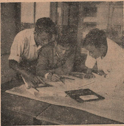
採礦系教師為邯鄲冶金公司進行基村礦山的施工設計。圖為他們正和礦山同志（右）研究施工問題。