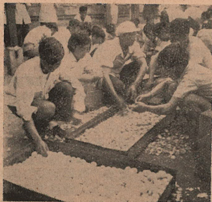
院同學一次要吃一萬個。 同學幫炊事員剝雞蛋。全 晨歌攝影

現在，炊事員躍進規劃已制定完畢，他們提出，要在1958年內爭取成為“紅旗”食堂。(馮德禮)