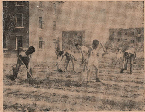
創地施肥，讓作物多長快長，勤工儉學小組同學經過數月勞動，已漸漸豐富了農業生產的經驗。

参加这次突击工作的还有制图和另件教研組的教师，他們热情的指导，給同學們帶來很大的鼓舞。(仲闊)