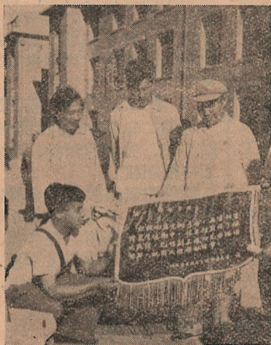
我院衛生工作大躍進。海峽區愛衛會授予我院一等獎旗。旗上寫着“積極響應黨的號召，在除四害講衛生運動中，你單位取得了很大成績，已作到三潔四無，希積極努力，鞏固成績保持經常”。

取消臨時廁所，或設法保持清潔，消滅蚊蠅孳生條件。 七、經常批評表揚，在評比後，對好的單位和個人給予表揚，對差的單位和個人，給予批評，並以挑戰應戰的形式，展開紅旗競賽。 上列辦法，是使我院經常保持三潔四無的幾項措施，希望大家研究實行，以永遠保持四無學院的光榮稱號。