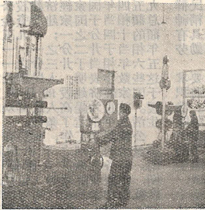
為了使同學做好實驗，材料力學實驗室的工作人員在進行實驗前的準備工作。