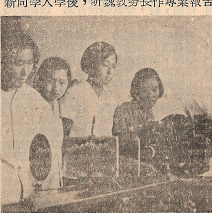
新同學參觀冶金系煉鋼實驗展覽室