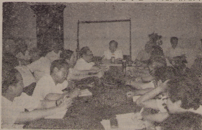
在党委常委扩大会议上，同志们认真学习领会小平讲话和四中全会文件。

一致表示相信中央新的领导核心一定能担负起建设四化，振兴中华的历史重任。有的常委指出，平息反革命暴乱已经取得了决定性胜利，当前要认真学习贯彻四中全会文件精神，另外要扎扎实实办一些实事，取信于民。因此，完全拥护四中全会提出的当前要抓紧做好的四件大事，要在党中央领导下，认真细致地做好本职工作。