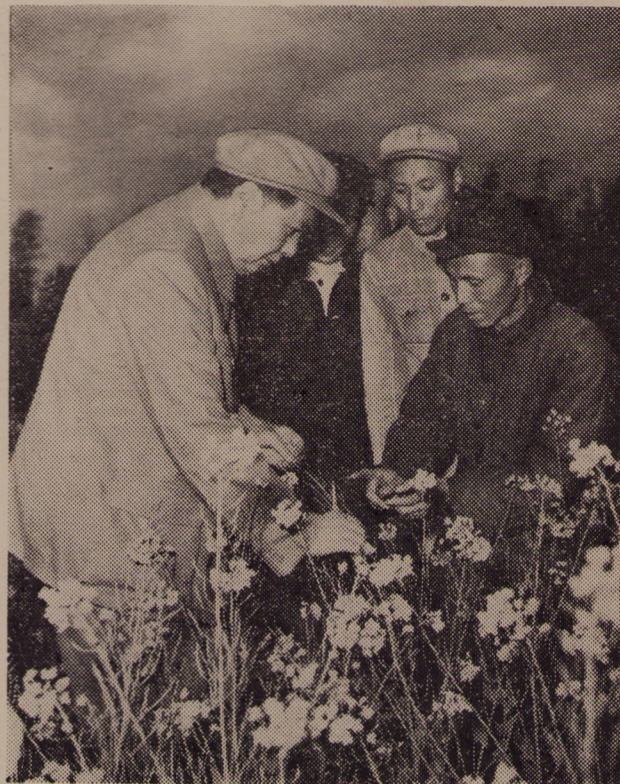
→ 毛主席在四川农村视察。