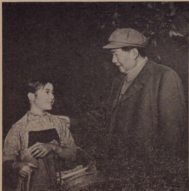
← 毛主席在长春电影制片厂和小演员亲切交谈。