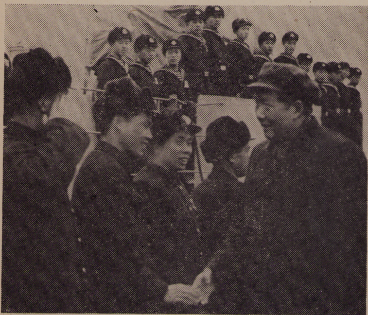
↑ 毛主席视察南昌号军舰时，和海军指战员握手。