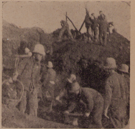
戰鬥在密雲礦山的時候