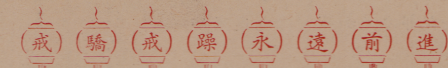
我院煉鋼先進集體和青年煉鋼積極分子名單